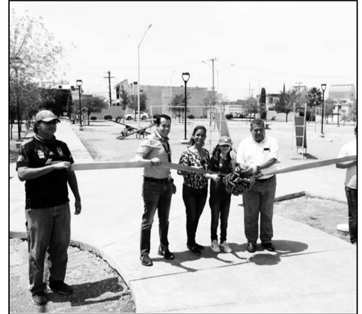
Es una de las plazas más grandes del sector

grupos de edades en la comunidad”, dijo el municipio. “En la parte poniente es de los parques más grandes y estamos dejando pendientes algunos trabajos para una segunda etapa, ya que lo que entregamos hoy son básicamente elementos de infraestructura urbana, dejando pendiente todo el ornamento y jardinería, debido a la escasez del agua, pero el año entrante se retomará esto para su rehabilitación”, añadió.(CLR)